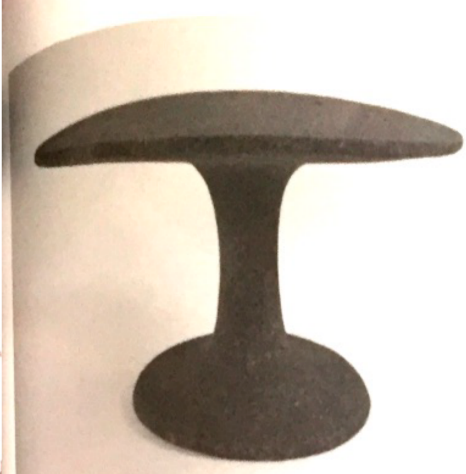
Siento sin cuenta